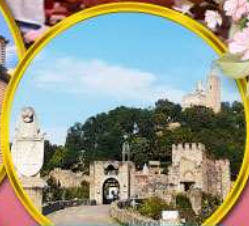
ป้อมชาเรเวทลี