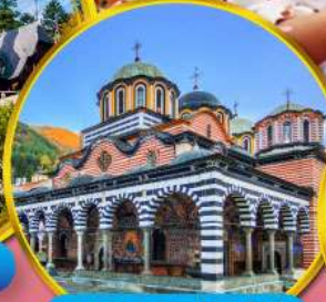
อารามมรดกโลกริลา