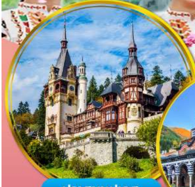
ปราสาทเปเลส