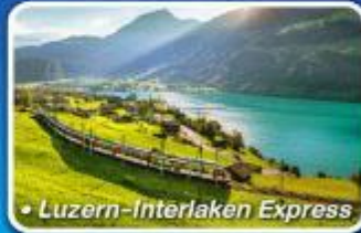
• Luzern-Interlaken Express