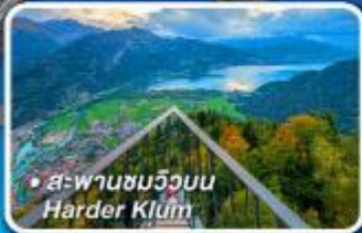
• ส-พานงมวูวบน Harder Klüen