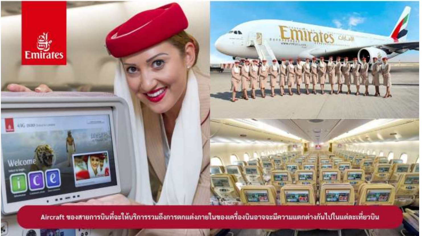
Aircraft ของสายการบินที่จะให้บริการรวมถึงการตกแต่งภายในของเครื่องบินอาจมีความแตกต่างกันไปในแต่ละเที่ยวบิน

23.00 น. 🛫 คณะเดินทางพร้อมกัน ณ สนามบินสุวรรณภูมิ อาคารผู้โดยสารขาออกระหว่างประเทศ ชั้น 4 ประตู 9 แถว T สายการบินเอมิเรตส์ แอร์ไลน์ (EK) เจ้าหน้าที่ให้การต้อนรับและอำนวยความสะดวก