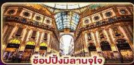
ช้อปปิ้งมิลานจุใจ

เดินทาง : 9-16 ก.พ. / 9-16 มี.ค. / 23-30 มี.ค. 88