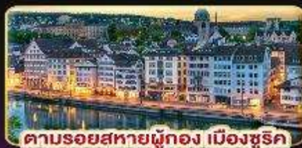
ตามรอยสหราชอาณาจักร เมืองซูริค

พักซูริค 2 คืนติด พักอินเทอลากันท์ 2 คืนติด