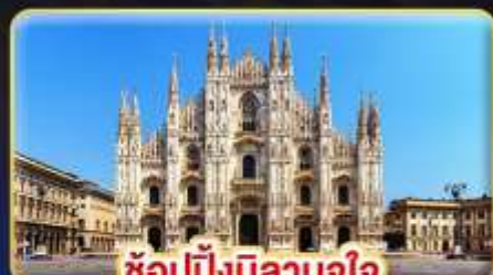
ช้อปป์มิลานจุใจ

ที่สุดของธรรมชาติ แห่ง "ยุโรป" มากกว่าการท่องเที่ยว แต่ได้พักผ่อนเต็มที่ โปรแกรมไม่รับเร่ง