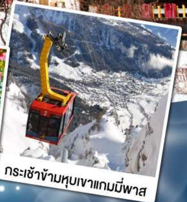
กระเช้าข้ามหุบเขาแกมมีพาส