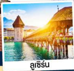
ลูซิิร์น

ณ เมืองลูคอร์เนค เมืองแห่งน้ำแร่สวิตเซอร์แลนด์