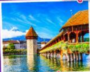
ลูซิเิร์น

เดินทาง 31 พ.ค. - 07 มิ.ย. 68 08-15 ส.ค. 68