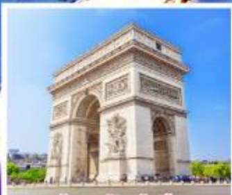
ประตูลิชัยปารีส

เดินทาง 31 พ.ค. - 07 มิ.ย. 68 08-15 ส.ค. 68