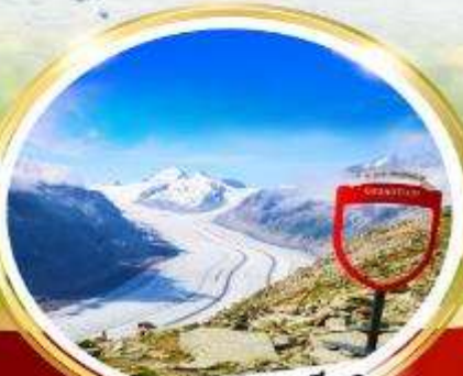
อาเล็กซารีนา