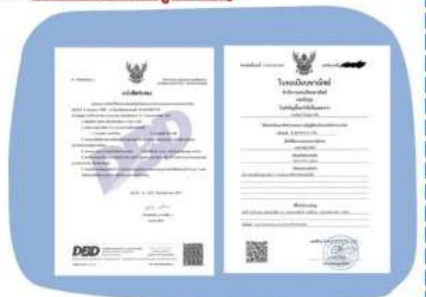
ตัวอย่างหนังสือจดทะเบียนบริษัท และ ใบทะเบียนพาณิชย์