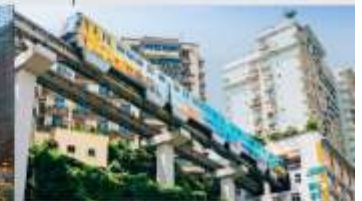
รถไฟฟ้าทะเลตึก

*ทางบริษัทฯ ขอสงวนสิทธิ์ในการสลับโปรแกรมทัวร์ตามความเหมาะสมขึ้นอยู่กับสถานการณ์ปัจจุบัน โดยคำนึงถึงผลประโยชน์ของลูกค้าเป็นสำคัญ