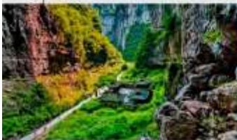
อุทยานแห่งชาติหลุมฟ้า 3 สะพานสวรรค์