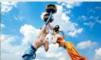
Wulong Flying Kiss