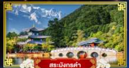
สระมิงกรค่า