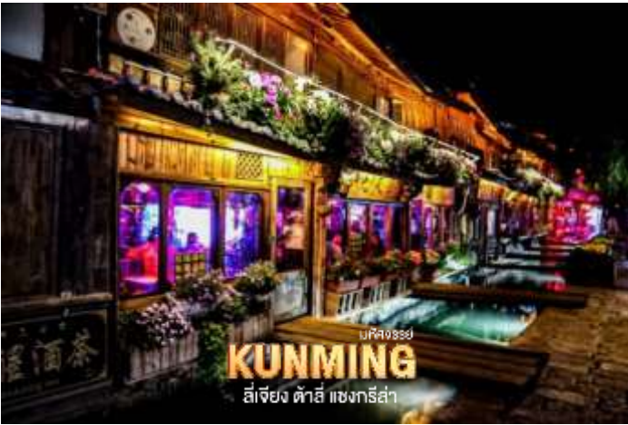
ที่พักวิว KUNMING ลี่เจียง ต้าอี้ แซงกรีล่า