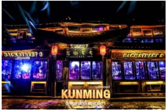
ที่พักวิว KUNMING ลี่เจียง ต้าอี้ แซงกรีล่า

ค่า ๑๐ บริการอาหารเย็น ณ ภัตตาคาร จากนั้น พักที่ FENG HUANG YANG SHENG HOTEL หรือระดับเทียบเท่า ★★★★★