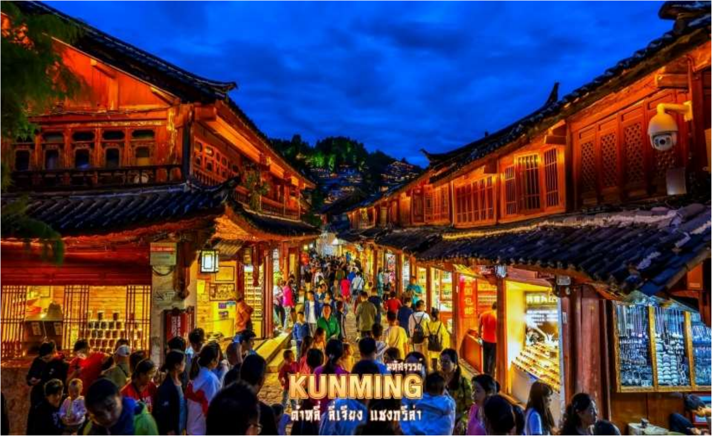
ที่พักวิว KUNMING ต้าตี่ ดีเจียง แซงกรีล่า