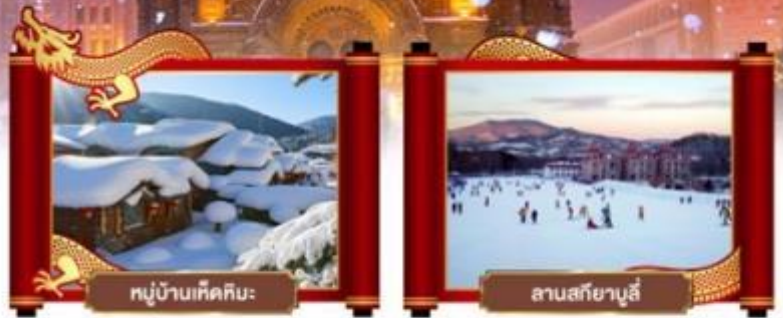
หมู่บ้านหิมะหิมะ

• มหัศจรรย์ดินแดนกุหลาบ หมู่บ้านหิมะแห่งความฝัน