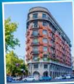
ถนนอู่คัง