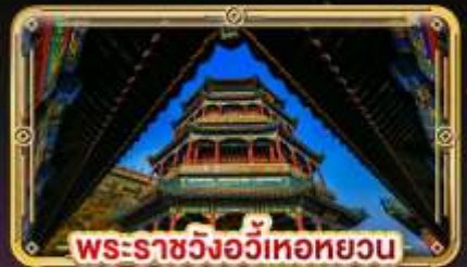
พระราชวังอวิหะทยวน