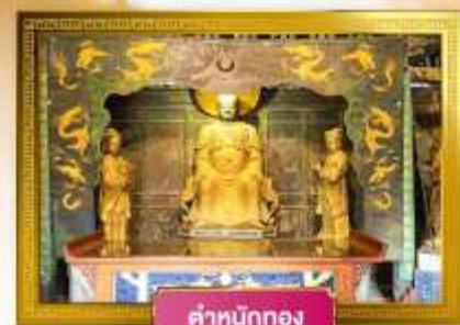
ตำหนักทอง