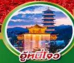
อุ๋นซีโจว