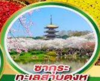
ซากุระ ทะเลสาบคงหู