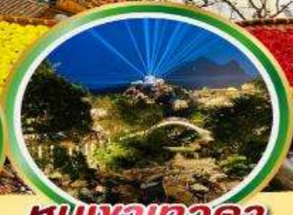
หุบเขาทวดา