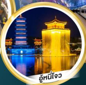
อุ๋หนี่โจว