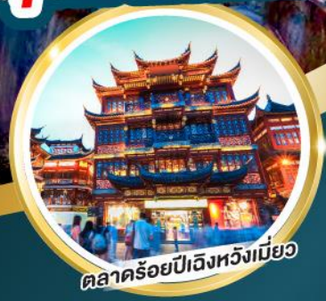
ตลาดร้อยปีเฉิงหวงเหมี่ยว