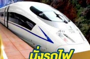
นั่งรถไฟ ความเร็วสูง