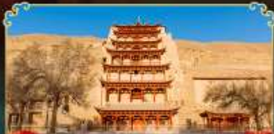
กำแพงสลักม่อเถาตู