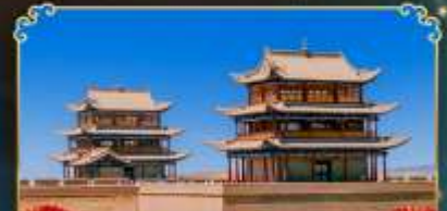
กำแพงเมืองจีนเจียวอวี่กวน