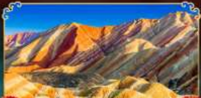
ภูเขาสายรุ้งจางเย่

เดินทางตามรอยเส้นทางสายประวัติศาสตร์โลก ชมโอเอซิสกลางทะเลทราย "ทะเลสาบพระจันทร์เสี้ยว"