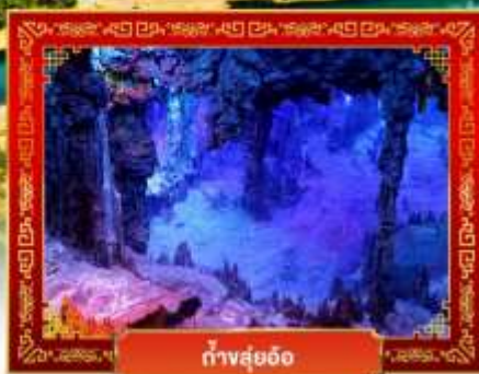
ถ้ำสุ่ยอ้อ