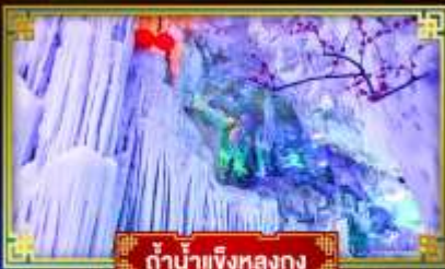
ตำนานเงี้ยวหลงกวง

"เที่ยว 2 มณฑล กวางซี-กัชโจว" สุดอลังการ น้ำตก 2 พรมแดน แหล่งท่องเที่ยวระดับ 5A