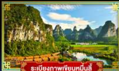
ระเบียบภาพเขียนหมินอี