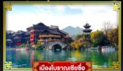
เมืองโบราณเซี่ยซือ