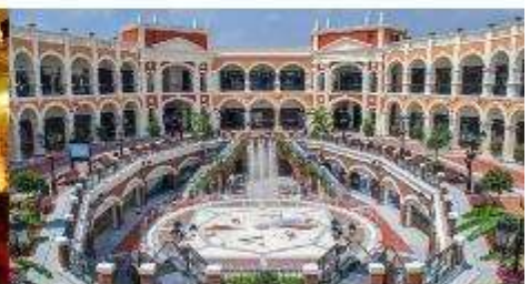
Florentia Village Outlet

*ทางบริษัทฯ ขอสงวนสิทธิ์ในการสลับโปรแกรมทัวร์ตามความเหมาะสมขึ้นอยู่กับสถานการณ์ปัจจุบัน โดยทำผิดซึ่งผลประโยชน์ของลูกค้าเป็นสำคัญ