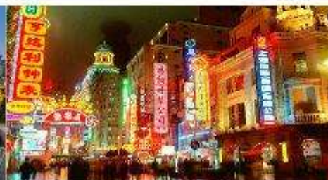
ถนนนานกิ่ง