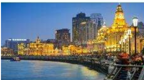
หาดไว่ถาน