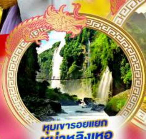
หุบเขารอยแยก หน้าหลิงเหอ