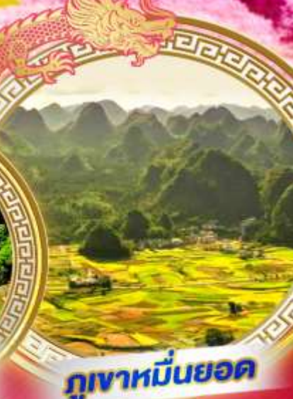
ภูเขาหมื่นยอด