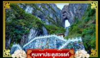
หุบเขาประตูสวรรค์