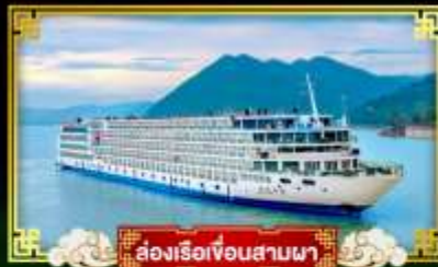
ล่องเรือเขื่อนสามผา