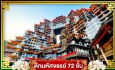
คกบาศจรรย 72 ชั้น