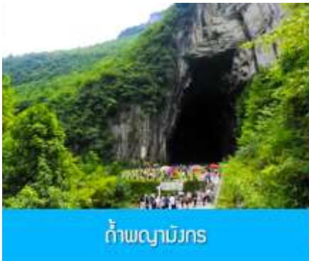
ถ้ำผญามังกร

พักที่ YICHANG HUIHAO HOTEL โรงแรมระดับ 4 ดาวหรือเทียบเท่าในเมืองหฺยิซัง