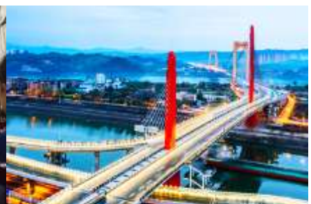
เมืองหยีซา