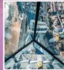
QINGDAO HAITIAN CENTER