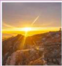
ยอดเขาอวิ้อวาง