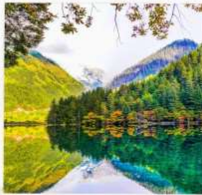
อุทยานจิวจ้ายโกว