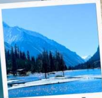
อุทยานชวงเจียวโกว