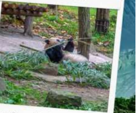
ศูนย์อนุรักษ์หมีแพนด้า