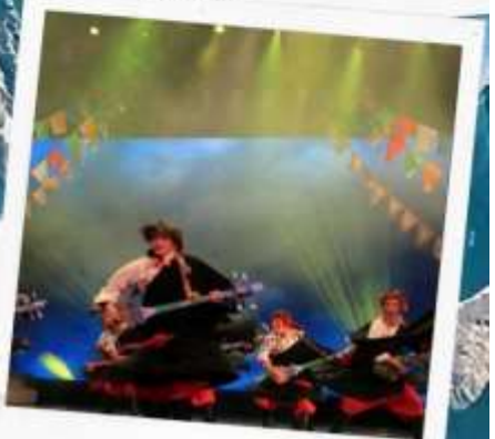
โชว์ทิเบต