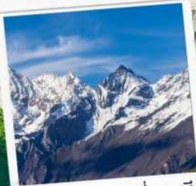
อุทยานภูเขาสี่ดรุณี