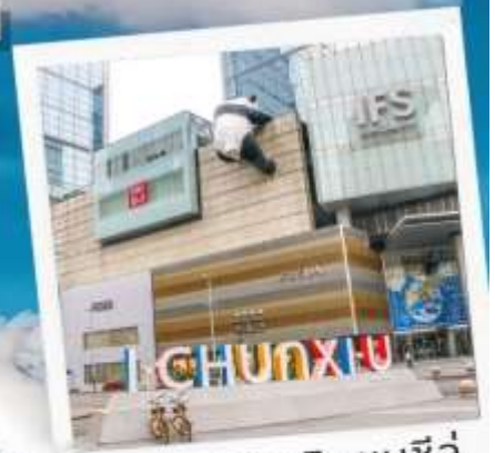
ถนนคนเดินชุนซีลู่