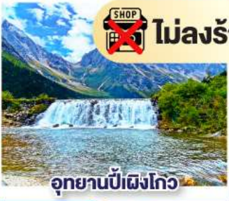
อุทยานπίฝั่งโกว