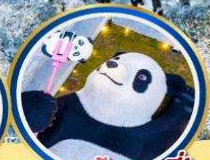
แพนด้าเซลฟี