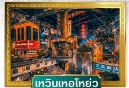
เหวินเหอโฮ่ย