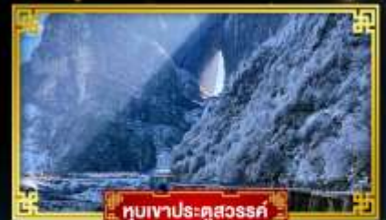
หุบเขาประตูสวรรค์