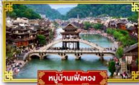
หมู่บ้านเฟิ่งหวง