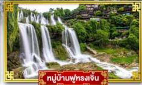
หมู่บ้านฟุทงเจิ้น