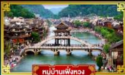
หมู่บ้านเฟิ่งหวง