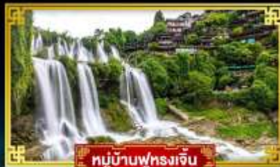
หมู่บ้านฟุหลงเจิ่น