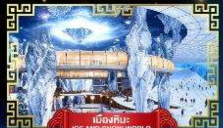
เมืองหิมะ ICE AND SNOW WORLD