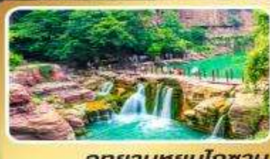
อุทยานหยุ่นโกซาน