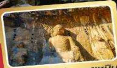
ผาแกะสลักหลงเหมิน