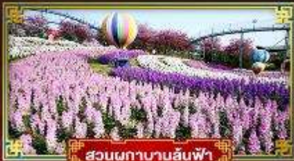
สวนดอกบานล้นฟ้า