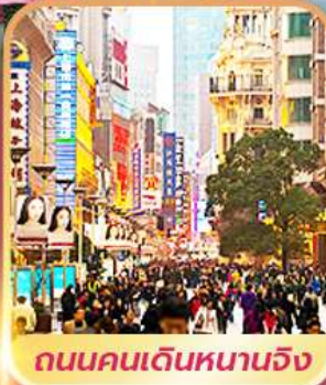
ถนนคนเดินหนานจิง