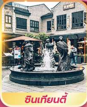
ซินเทียนตี้