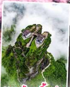
อุทยานกุหลาบพันปี หมู่บ้านแม่วชิเจียง