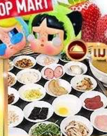
ขนมจีนข้ามสะพาน