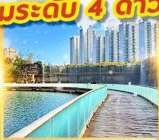
สวนน้ำตกคุณหมิง