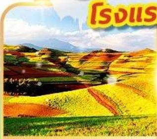
แผ่นดินสีแดงตงชวน