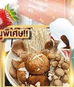
สุกี้เห็ด