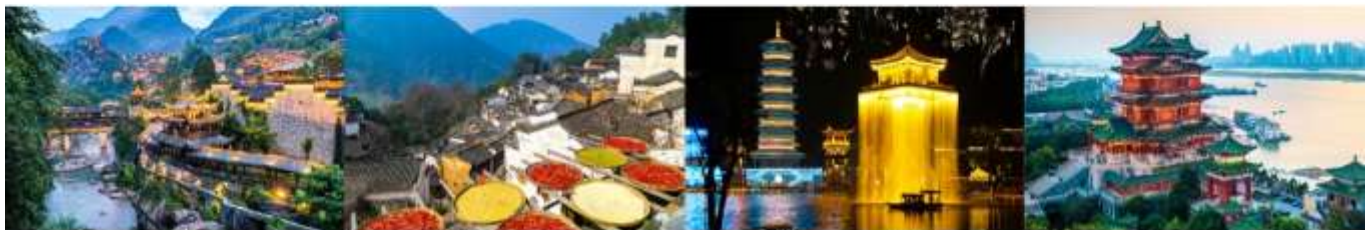
หุบเขาเทวดาฉางเซี่ยนกู่