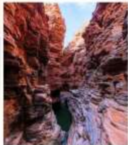
แกรนด์แคนยอนยูลาโกว