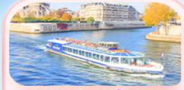
คลองเรือแม่น้ำแซน