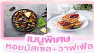
เมนูพิเศษ หอยมัสเซล+วาฟเฟิล