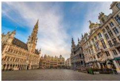
รูปปั้นแมนเนเก่นพีส