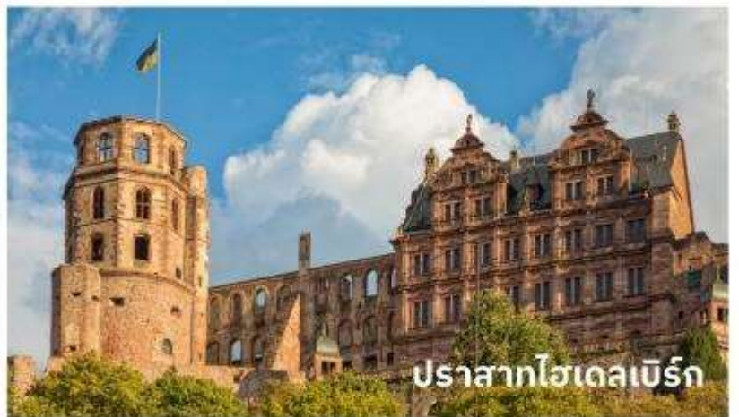
ปราสาทไฮเดลเบิร์ก

จากนั้นนำท่าน เข้าชมปราสาทไฮเดลเบิร์ก ตั้งอยู่บนเนินเขาโดยรอบมีป่าละเมาะแสนสวยให้นักท่องเที่ยวสามารถเดินเล่นได้ บริเวณปาร์กของปราสาทจะมีต้นไม้ใหญ่อย่างต้นเบิช ต้นเมเปิ้ล ต้นโอ๊ค เมื่อขึ้นไปอยู่บนเนินเขาที่ตั้งของปราสาทจะมีจุดชมวิวที่จะมองลงไปดูตัวเมืองเก่าไฮเดลเบิร์ก และยังเห็นแม่น้ำเนคคาร์ ที่ไหลผ่าน ตัวเมืองไฮเดลเบิร์กอีกด้วย