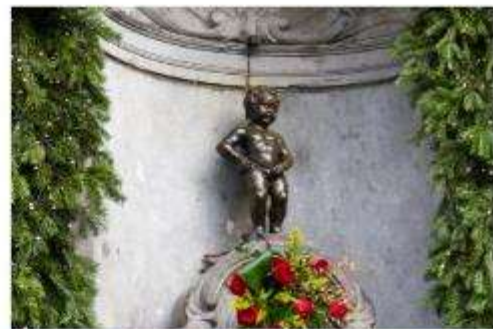
รูปปั้นแมนเนเก่นพีส