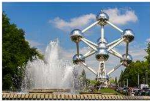
อะตอมเนียม