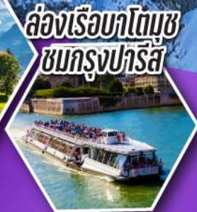
ล่องเรือบาโตมุซ ชมกรุงปารีส

เที่ยวเมืองวาอุซ เมืองหลวงของสาธารณรัฐ ลิกเทินสไตน์