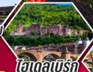
ไฮเดลเบิร์ก