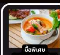
มือพิเศษ อาหารไทยในยุโรป