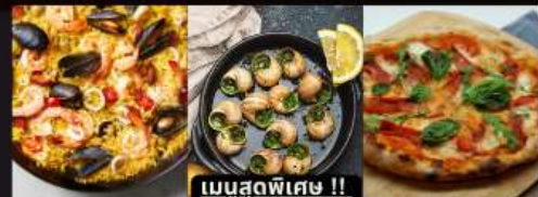
PAELLA ข้าวผัดสเปน / หอยแอสคาโก้ / พืชข่ามาการ์ต้า