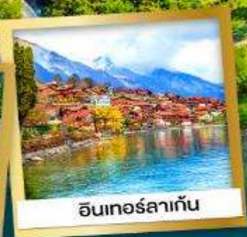
อินเทอร์ลาเก้น