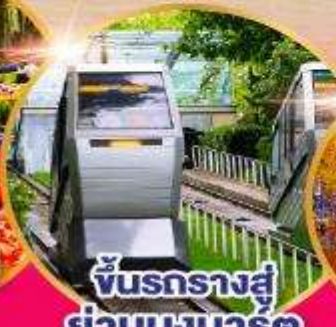
ชั้นรถรางสู่ ย่านมงมาร์ต