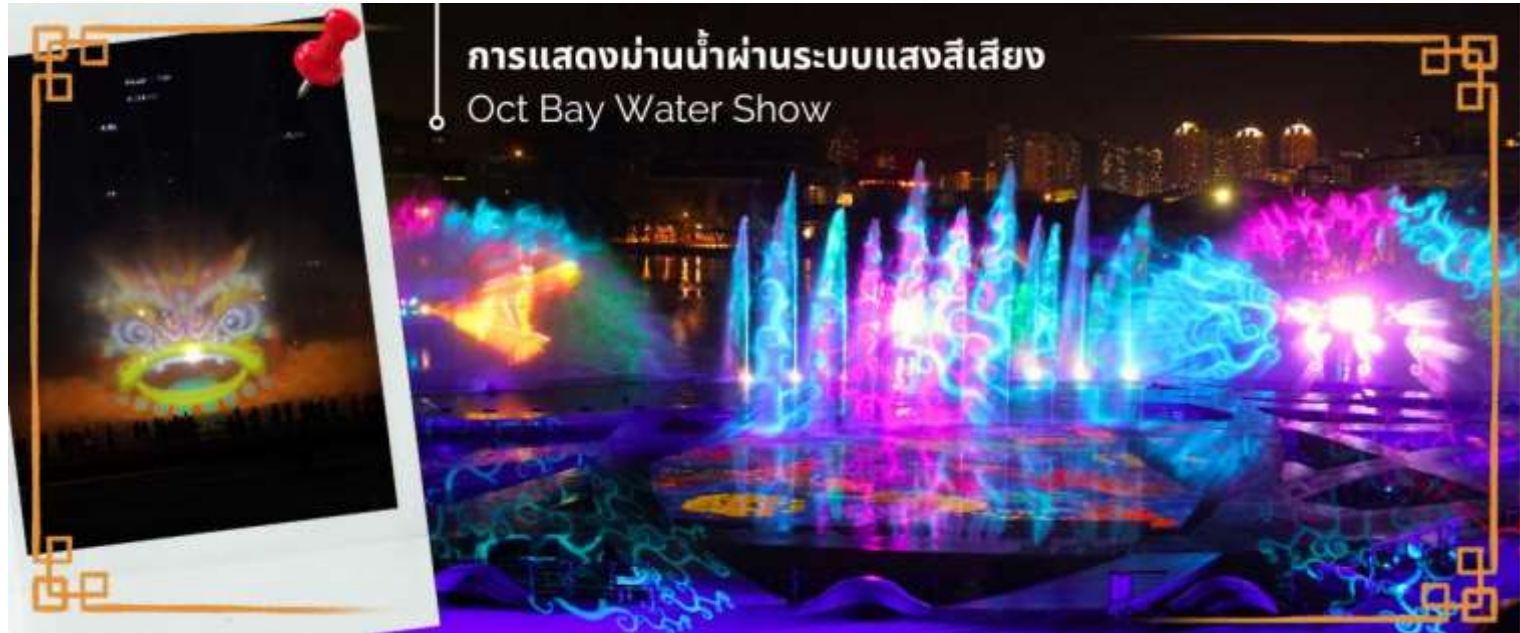
การแสดงม่านน้ำผ่านระบบแสงสีเสียง Oct Bay Water Show

โรงแรมที่พัก นำท่านเดินทางเข้าสู่ที่พัก Shenzhen Trends Luohu or Similar 3* Hotel ★★ ★ หรือเทียบเท่า วันที่สอง เซินเจิ้น - วัดกวนอู - ร้านหยก - ร้านยาสมุนไพร - บ้านหิมะ SNOW WORLD - ช้อปปิ้งล่อหู่