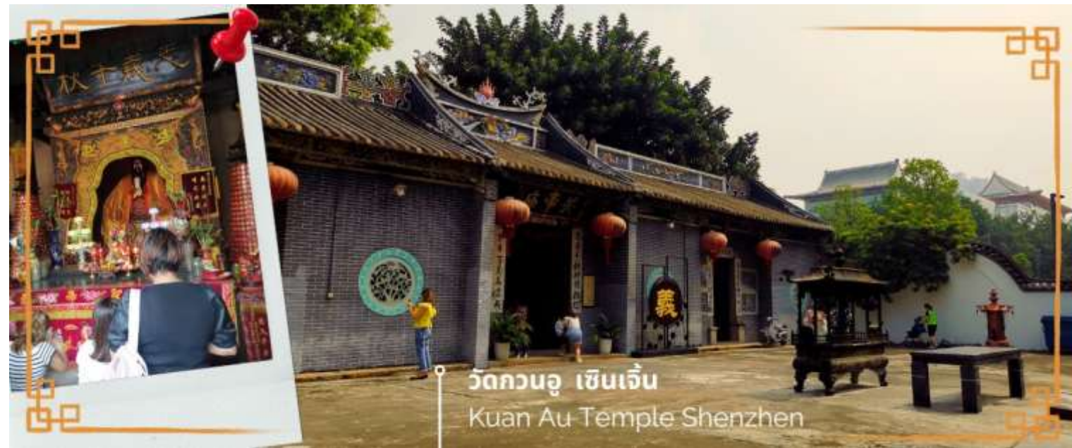
วัดกวนอู เซินเจิ้น Kuan Au Temple Shenzhen

เช้า ☉ บริการอาหารเช้า ณ ห้องอาหารของโรงแรม (3) จากนั้นนำท่านเดินทางสู่ วัดกวนอู ไหว้เทพเจ้ากวนอู สัญลักษณ์ของความซื่อสัตย์ ความกตัญญูรู้คุณ ความจงรักภักดี ความกล้าหาญ โชคลาภ และบารมี ท่านเปรียบเสมือนตัวแทนของความเข้มแข็งเด็ดเดี่ยวของอาจไม่ครั้งคร้ามต่อศัตรู ท่านเป็นคนจิตใจมั่นคงตั้งขุนเขา มีสติปัญญาเฉลียวฉลาด และไม่เคยประมาทการบูชาขอพรท่านก็หมายถึงขอให้ท่านช่วยอุดช่องว่างไม่ให้เพลิงงพล้ำแก่ฝ่ายตรงข้าม และให้เกิดความสมบูรณ์ด้วยคนข้างเคียงที่ซื่อสัตย์ หรือบิรวารที่ไว้วางใจได้นั่นเองตั้งนั้นประชาชนคนจีนจึงนิยมบูชา และกราบไหว้เพื่อความเป็นสิริมงคลต่อตนเอง และครอบครัวในทุกๆ ด้าน