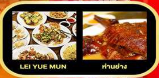
LEI YUE MUN