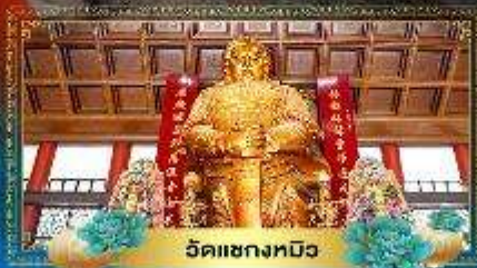
วัดเซกตงทิว