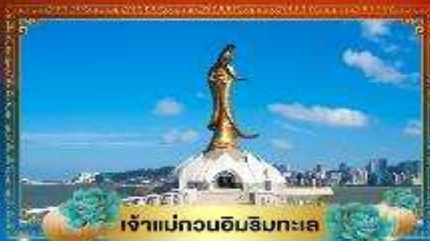
เจ้าแม่กวนอิมรับทะเล