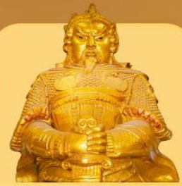
วัดแชกงหมิว