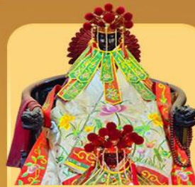
เจ้าแม่กวนอิมสองขำ